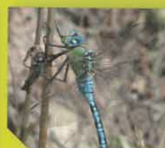
Taille d'une aile : 35mm