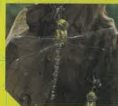
Taille d'une aile : 45mm