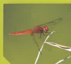
Taille d'une aile : 55mm